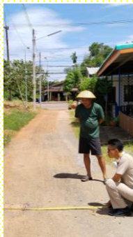
ม.6 ซ.โรจนามนต์