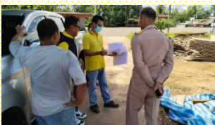
ตรวจสอบการสร้างสิ่งปลูกสร้างที่ ม.6

ในเดือน ก.ค. 2566 นี้ กองช่าง อบต.แหลมงอบ นำโดยผู้บริหารและ ผอ.กองช่าง ลงพื้นที่ ตรวจสอบการสร้างสิ่งปลูกสร้างทั้งหมด 3 แห่ง ที่ ม.3 ม.6 และ ม.7 เพื่อประกอบการออกใบอนุญาต ก่อสร้างฯ นอกจากนี้เจ้าหน้าที่กองช่าง ยังได้ลงพื้นที่เพื่อร่วมกับผู้ที่เกี่ยวข้องในการรั้วที่ดินที่ติดกับ ที่สาธารณะในพื้นที่ตำบลแหลมงอบ ตามที่ได้รับแจ้งจากสำนักงานที่ดิน จ.ตราด ส่วนแยกแหลมงอบ ทั้งหมด 2 แห่งในพื้นที่ ม.6 และ ม.7 ต.แหลมงอบ