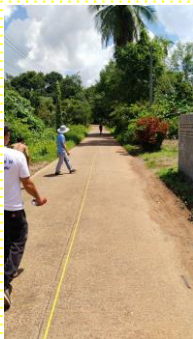
ม.1 ซ.ทางเข้า ร.แหลมงอบวิทยาคม