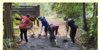
ปรับปรุงผิวถนนสายต้นกระบกร้อยปี