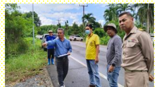
เข้าร่วมรั้ววัดที่ ม.7