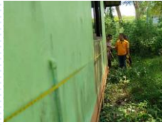
ตรวจสอบ ประกอบการออก ใบรับรองสิ่งปลูกสร้าง