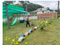
ศพด.บ้านกลาง