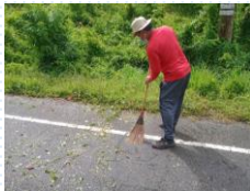
ถนนเลียบบคลองตะแบกมาลา