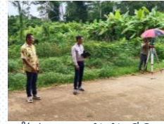
เข้าร่วมการรังวัดที่ดิน ที่ ม.2