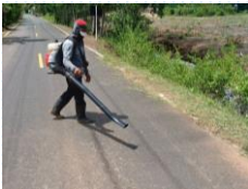
ถนนทางเข้าหาดทรายดำ