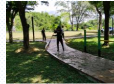
ดำเนินการปรับปรุงภูมิทัศน์ที่อนุสรณ์สถานยุทธนาวีที่เกาะช้าง