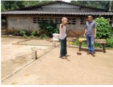
ตรวจสอบ ประกอบการออก ใบอนุญาตก่อสร้างฯ

ในเดือนสิงหาคม 2566 กองช่าง อบต.แหลมวงอบ ได้มีการลงพื้นที่เพื่อตรวจสอบการก่อสร้างและสิ่งปลูกสร้าง เพื่อประกอบการออกใบอนุญาตก่อสร้างฯ 2 แห่ง และเพื่อการออกใบรับรองสิ่งปลูกสร้างฯ 3 แห่ง นอกจากนี้ ยังได้เข้าร่วมการรังวัดที่ดินที่ติดกับที่สาธารณะ กับเจ้าหน้าที่จากสำนักงานที่ดิน จ.ตราดส่วนแยกแหลมวงอบ และผู้ที่เกี่ยวข้อง ในพื้นที่ ม.2 และ ม.3 ต.แหลมวงอบ