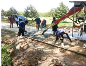
สายสระน้ำ ม.6 บ้านกลาง อยู่ระหว่างดำเนินการอีก 1 ฝั่ง