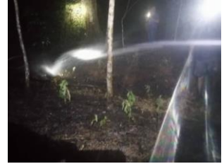
ร่วมระงับเหตุไฟไหม้ ต.น้ำเชี่ยว