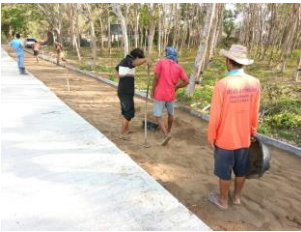
สายหลังโรงเรียนแหลมวงอภ วิทยาคม ม.1 บ้านแหลมวงอภ อยู่ระหว่างดำเนินการอีก 1 ฝั่ง

นอกจากนี้ยังออกสำรวจถนนเพิ่มเติม ร่วมกับ ส.อบต. ในพื้นที่ทั้ง 7 หมู่ ในตำบลแหลมวงอภ เพื่อนำเข้าแผนฯ และดำเนินการปรับปรุงถนนต่อไป