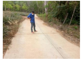
ตรวจสอบถนนสายหนองแฝก ม.7 บ้านหนองปรือ ก่อนหมดสัญญา ประกัน

ทีมงานกองช่าง ยังได้ลงพื้นที่สำรวจและวัดขนาดฝาท่อระบายน้ำ ที่ชำรุดในพื้นที่ ม.7 บ้านหนองปรือ ตามที่ได้รับแจ้งจากนางนิภาพร มีสนม ส.อบต.ม.7 เมื่อวันที่ 13-14 ก.พ. 2566 และบริเวณทางเดินเท้าริมถนนสายทางเข้า รพ.แหลมวงอภ เมื่อวันที่ 21 ก.พ. 2566 ก่อนจะนำกลับมาซ่อมแซมและวางคืนที่เดิม เพื่อป้องกันการเกิดอุบัติเหตุ