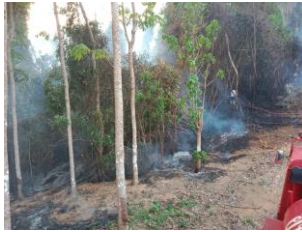
ร่วมระงับเหตุไฟไหม้ ต.คลองใหญ่