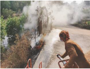
ระงับเหตุไฟไหม้ ต.แหลมวงอบ

เมื่อวันที่ 21 ก.พ. 2566 เวลา 16.05 น. อบต.แหลมวงอบได้รับแจ้งเหตุไฟไหม้บริเวณใกล้ รีสอร์ท บ้านไม้ทรายดำ ม.6 บ้านกลาง เมื่อถึงที่เกิดเหตุพบไฟไหม้หญ้าและป่าไม้ไฟ จึงดำเนินการระงับเหตุเสร็จเรียบร้อยเวลา 16.10 น. โดยไม่มีไฟลุกลามเพิ่มเติมไปบริเวณใกล้เคียง และในเวลา 17.30 น. โดยประมาณ อบต.แหลมวงอบ ได้รับแจ้งขอกำลังเสริมช่วยระงับเหตุไฟไหม้ในเขตพื้นที่ ต.คลองใหญ่ อ.แหลมวงอบ จึงได้ออกร่วมระงับเหตุ และเวลา 18.30 น. โดยประมาณ ก็ได้รับแจ้งเหตุไฟไหม้ส่วนของชาวบ้าน ที่เขาตะพง หมู่ 4 ต.น้ำเชี่ยว อ.แหลมวงอบ เจ้าหน้าที่จึงออกร่วมระงับเหตุดังกล่าวจนสามารถควบคุมไฟได้