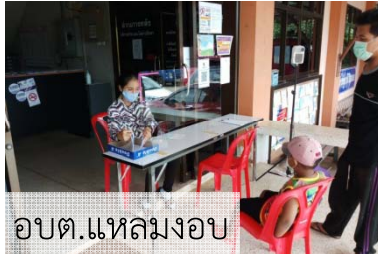
อบต.แหลมฉบัง