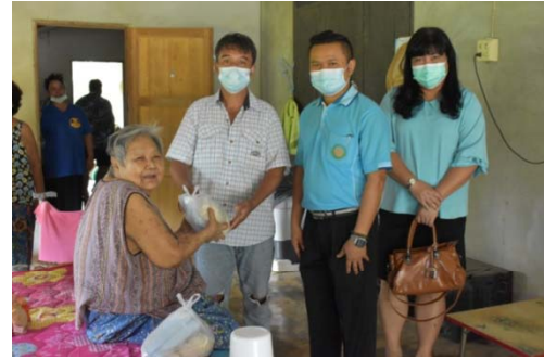
หมู่ 3 บ้านแหลมมะขาม 25 มิถุนายน 2564