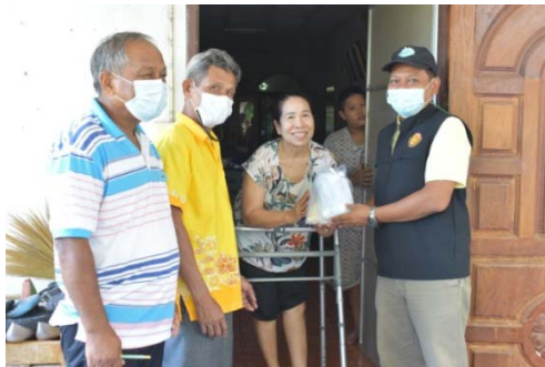
หมู่ 6 บ้านกลาง 28 มิถุนายน 2564