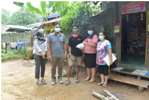
หมู่ 4 บ้านหัวหิน 24 มิถุนายน 2564