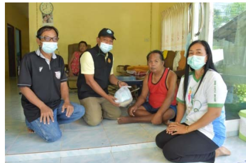
หมู่ 7 บ้านหนองปรือ 28 มิถุนายน 2564

นอกจากนี้ ยังให้ความร่วมมือกับหน่วยงานอื่น ๆ อำนวยความสะดวกให้แก่หน่วยควบคุมโควิดแรงงานทางทะเล (ศร ชล.) โดยการกางเต็นท์สนามเพื่อจัดสถานที่บริการตรวจคัดกรองโรคติดต่อโควิด-19 ให้แก่แรงงานจากเรือประมงที่เป็นกลุ่มเสี่ยง