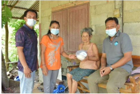
หมู่ 2 บ้านคลองปอ 24 มิถุนายน 2564