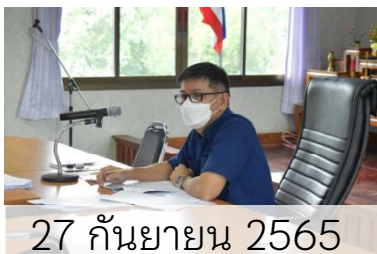
27 กันยายน 2565

นอกจากนี้ ในเดือนกันยายน 2565 อบต.แหลมงอบ ยังได้จัดประชุมคณะกรรมการสนับสนุนการจัดบริการดูแลระยะยาวสำหรับผู้สูงอายุที่มีภาวะพึ่งพิง อบต.แหลมงอบ เมื่อวันที่ 27 กันยายน 2565 ประชุมคณะทำงานจัดทำแผนปฏิบัติการป้องกันการทุจริตของ อบต.แหลมงอบ เมื่อวันที่ 29 กันยายน 2565 และประชุมคณะกรรมการกองทุนหลักประกันสุขภาพ เมื่อวันที่ 30 กันยายน 2565 อีกด้วย