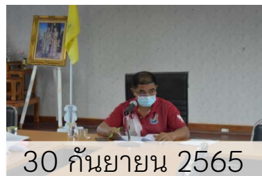
30 กันยายน 2565