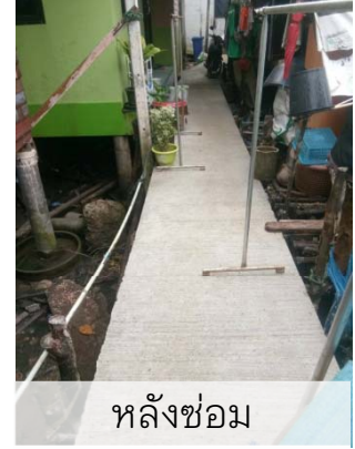
หลังซ่อม

นายฮารุญ ไพบูลย์ รองนายกฯ พร้อมนายธนวัฒน์ เทียนประชา ผอ.กองช่าง และทีมงานลงพื้นที่ตรวจสอบและวัดถนน ซ.โรจนมนต์ หมู่ 6 ที่เป็นดินลูกรัง ร่วมกับผู้ใหญ่บ้าน หมู่ 6 และได้พิจารณาลงหินคลุกเพื่อปรับผิวถนน เนื่องจากในเดือนกันยายนนี้มีฝนตกชุก ทำให้เกิดอันตรายและความไม่สะดวกในการสัญจรของประชาชนที่ใช้เส้นทางดังกล่าว