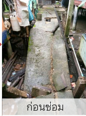
ก่อนซ่อม

ในเดือนกันยายน 2565 โครงการซ่อมแซมสะพานทางเดินเท้าที่ชำรุดที่หมู่ 5 บ้านแหลมทองกลาง ได้ดำเนินการแล้วเสร็จ และคณะกรรมการตรวจรับฯ ลงพื้นที่ตรวจสอบเป็นไปด้วยความเรียบร้อย เมื่อวันที่ 22 กันยายน 2565