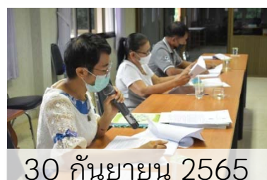
30 กันยายน 2565