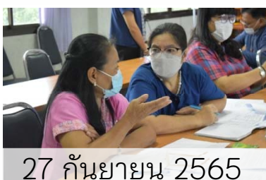
27 กันยายน 2565