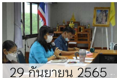
29 กันยายน 2565