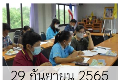
29 กันยายน 2565