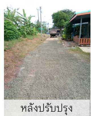
หลังปรับปรุง

วันที่ 16 กันยายน 2565 พนักงาน อบต.แหลมงอบ ได้รับมอบหมายให้นายางมะตอยปรับปรุงผิวถนนหน้าทางเข้าอาคารผู้ป่วยนอก ตามที่โรงพยาบาลแหลมงอบได้มีการขอความอนุเคราะห์