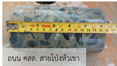
ถนน คสล. สายโป่งหัวเขา