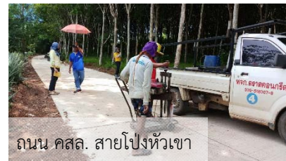
ถนน คสล. สายโป่งหัวเขา

นอกจากนี้ องค์การบริหารส่วนตำบลแหลมงอบบูรณาการร่วมกับหมวดทางหลวงวังกระแจะ แขวงทางหลวงตราด ตัดต้นไม้ยืนต้นตายเพื่อป้องกันเหตุสาธารณภัย ถนนสายตราด-แหลมงอบ บริเวณเนินสามชั้น เมื่อวันที่ 2 กรกฎาคม 2563 โดยทางองค์การบริหารส่วนตำบลแหลมงอบได้แจ้งการดำเนินการดังกล่าวผ่านสื่อเฟสบุ๊คเพื่อให้ผู้ที่กำลังจะผ่านเส้นทางในช่วงเวลาเช้าขับรถด้วยความระมัดระวัง