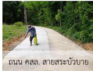
ถนน คสล. สายสระบัวบาย