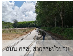
ถนน คสล. สายสระบัวบาย