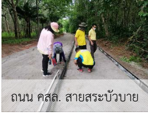
ถนน คสล. สายสระบัวบาย

ในเดือนกรกฎาคมนี้ องค์การบริหารส่วนตำบลแหลมงอบได้ดำเนินโครงการก่อสร้างถนนคอนกรีตเสริมเหล็กสายสระบัวบาย หมู่ 7 บ้านแหลมทองกลาง และตรวจรับถนนคอนกรีตเสริมเหล็กสายโป่งหัวเขา หมู่ 4 บ้านหัวหิน