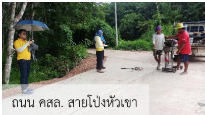
ถนน คสล. สายโป่งหัวเขา