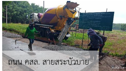
ถนน คสล. สายสระบัวบาย