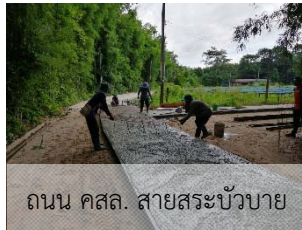
ถนน คสล. สายสระบัวบาย