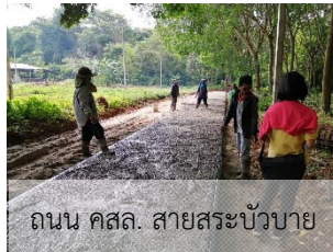
ถนน คสล. สายสระบัวบาย