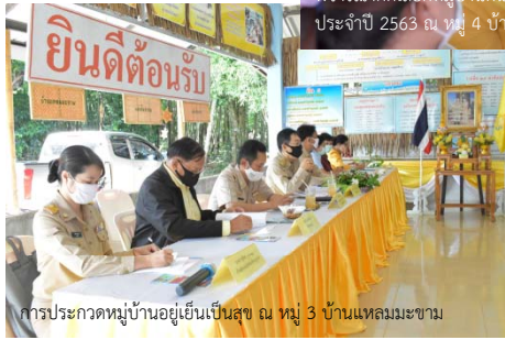
การประกวดหมู่บ้านอยู่เย็นเป็นสุข ณ หมู่ 3 บ้านแหลมมะขาม