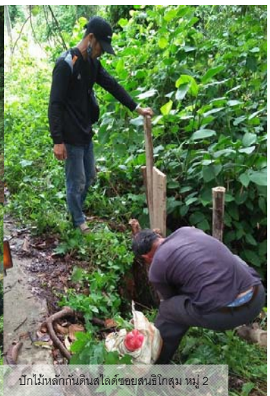
ปักไม้หลักกันดินสไลด์ซอยสนธิโกสุม หมู่ 2