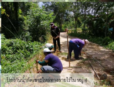
ป้องกันน้ำกัดเซาะไหล่ทางซอยไร่โน หมู่ 4