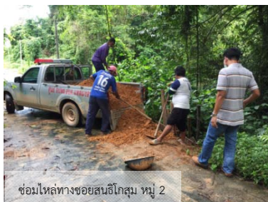
ซ่อมไหล่ทางซอยสนธิโกสุม หมู่ 2

นอกจากนี้ ในเดือนมิถุนายน 2563 นี้ องค์การบริหารส่วนตำบลแหลมงอบ ยังได้ดำเนินการซ่อมไหล่ทางซอยสนธิโกสุม หมู่ 2, ไหล่ทางคลองปอ-สระน้ำผี หมู่ 2 (หลังโรงน้ำปลาตามคำร้อง), ซ่อมทางและป้องกันน้ำกัดเซาะไหล่ทางซอยไร่โน หมู่ 4 และปักไม้หลักกันดินสไลด์ในซอยสนธิโกสุม หมู่ 2