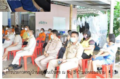
การประกวดหมู่บ้านอยู่เย็นเป็นสุข ณ หมู่ 3 บ้านแหลมมะขาม

วันที่ 17 มิถุนายน 2563 องค์การบริหารส่วนตำบลแหลมงอบ หมู่ 3 บ้านแหลมมะขาม รวมทั้งปลัดอำเภอแหลมงอบ โรงพยาบาลแหลมงอบ และโรงเรียนวัดแหลมมะขาม ให้การต้อนรับคณะกรรมการตัดสินการประกวดโครงการชุมชนปลอดขยะ (Zero Waste) ปี 2563 ระดับภาค ณ ชุมชนบ้านแหลมมะขาม ต.แหลมงอบ อ.แหลมงอบ จ.ตราด พร้อมบรรยายสรุปข้อมูลชุมชนปลอดขยะบ้านแหลมมะขาม ตอบข้อซักถามและลงตรวจพื้นที่จริง