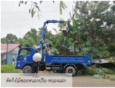
ตัดกิ่งไม้ซอยหนองปรือ-หนองแม่

ในเดือนมิถุนายนนี้มีฝนตกหนักและลมแรงเป็นบางช่วง ทำให้มีกิ่งไม้หักขวางถนนและทับหลังคาบ้านของชาวบ้าน งานป้องกันและบรรเทาสาธารณภัย องค์การบริหารส่วนตำบลแหลมฉบังก็ได้ให้การช่วยเหลือ ตัดกิ่งไม้ และซ่อมแซมหลังคาที่ชำรุดเสียหายจากเหตุฝนตกลมแรงดังกล่าวตามที่ได้รับแจ้งจากชาวบ้านและสมาชิกสภาองค์การบริหารส่วนตำบลแหลมฉบังที่อยู่ในพื้นที่