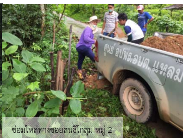
ซ่อมไหล่ทางซอยสนธิโกสุม หมู่ 2