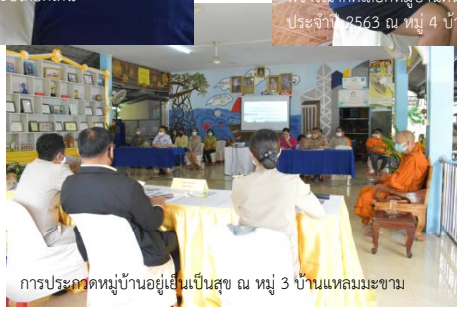
การประกวดหมู่บ้านอยู่เย็นเป็นสุข ณ หมู่ 3 บ้านแหลมมะขาม