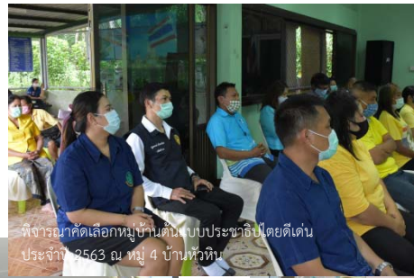
พิจารณาคัดเลือกหมู่บ้านต้นแบบประชาธิปไตยดีเด่น ประจำปี 2563 ณ หมู่ 4 บ้านหัวหิน