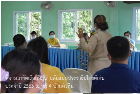
พิจารณาคัดเลือกหมู่บ้านต้นแบบประชาธิปไตยดีเด่น ประจำปี 2563 ณ หมู่ 4 บ้านหัวหิน

ในวันที่ 12 มิถุนายน 2563 องค์การบริหารส่วนตำบลแหลมงอบ เข้าร่วมฟังและเป็นที่กำลังใจในการพิจารณาคัดเลือกหมู่บ้านต้นแบบประชาธิปไตยดีเด่น ประจำปี 2563 ณ หมู่ 4 บ้านหัวหิน และวันที่ 15 มิถุนายน 2563 ก็ได้เข้าร่วมรับฟังและให้กำลังใจในการประกวดหมู่บ้านอยู่เย็นเป็นสุข ณ หมู่ 3 บ้านแหลมมะขาม