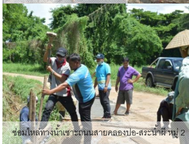
ซ่อมไหล่ทางน้ำเซาะถนนสายคลองปอ-สระน้ำผี หมู่ 2