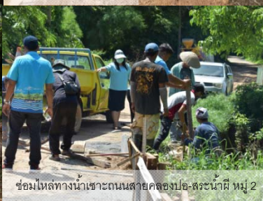
ซ่อมไหล่ทางน้ำเซาะถนนสายคลองปอ-สระน้ำผี หมู่ 2