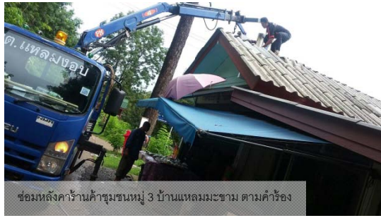
ซ่อมหลังคารั่วน้ำชุมชนหมู่ 3 บ้านแหลมมะขาม ตามคำร้อง