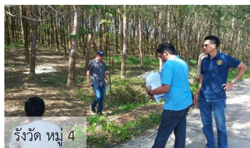
รังวัด หมู่ 4

นอกจากนี้ องค์การบริหารส่วนตำบลแหลมงอบ ยังได้ดำเนินการบำรุงรักษา ซ่อมแซมไฟฟ้าส่องสว่างเพื่ออำนวยความสะดวกให้แก่ผู้ใช้เส้นทางสัญจรในพื้นที่เวลากลางคืน และดูแลซ่อมแซมระบบไฟฟ้าของปั้มน้ำที่ศาลาหมู่ 3