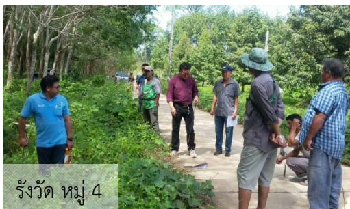
รังวัด หมู่ 4

องค์การบริหารส่วนตำบลแหลมงอบ ได้ดำเนินการดูแลและบำรุงรักษาโครงสร้างพื้นฐานในพื้นที่ตำบลแหลมงอบ อำเภอแหลมงอบ ตามที่ได้ตรวจพบความชำรุดเสียหาย และที่ได้รับแจ้งจากสมาชิกสภาองค์การบริหารส่วนตำบลแหลมงอบ ผู้ใหญ่บ้าน และชาวบ้านในพื้นที่ โดยในเดือนพฤศจิกายน 2563 นี้ ได้ซ่อมแซมถนนเป็นหลุมเป็นบ่อที่หมู่ 1 ถนนเลียบบคลองตะแบก มาลา 1 จุด และร่วมกับสำนักงานที่ดินจังหวัดตราด ส่วนแยกแหลมงอบ ดำเนินการระวางชี้แนวเขตบริเวณที่ติดกับเขตทางสาธารณประโยชน์ในพื้นที่