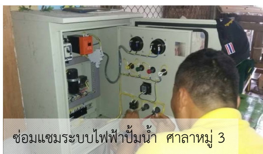
ซ่อมแซมระบบไฟฟ้าปั้มน้ำ ศาลาหมู่ 3